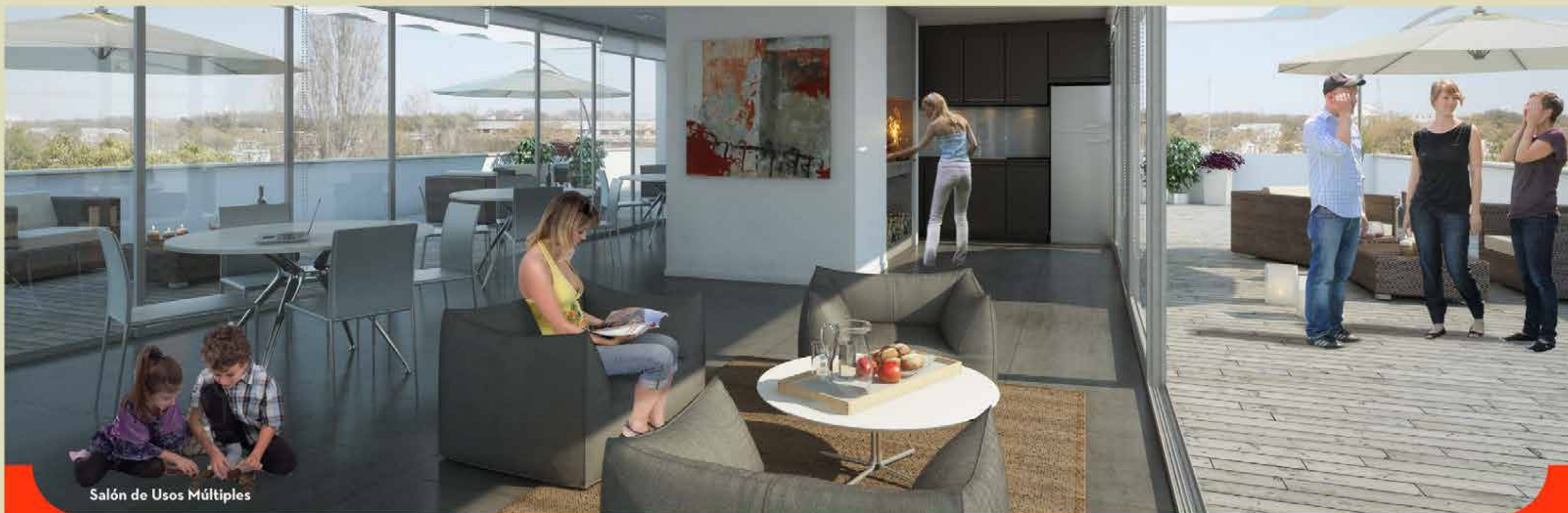
Salón de Usos Múltiples