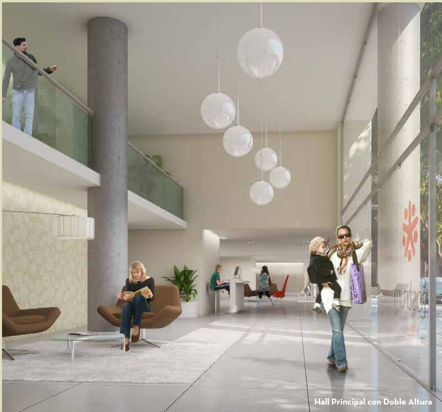
Hall Principal con Doble Altura