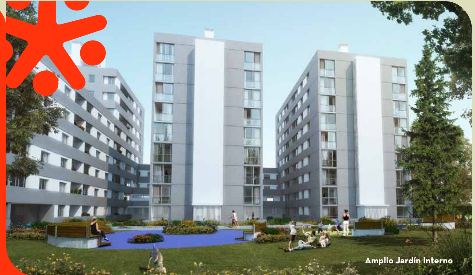
Amplio Jardín Interno