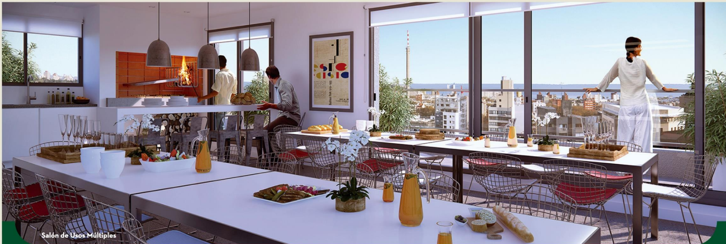
Salón de Usos Múltiples