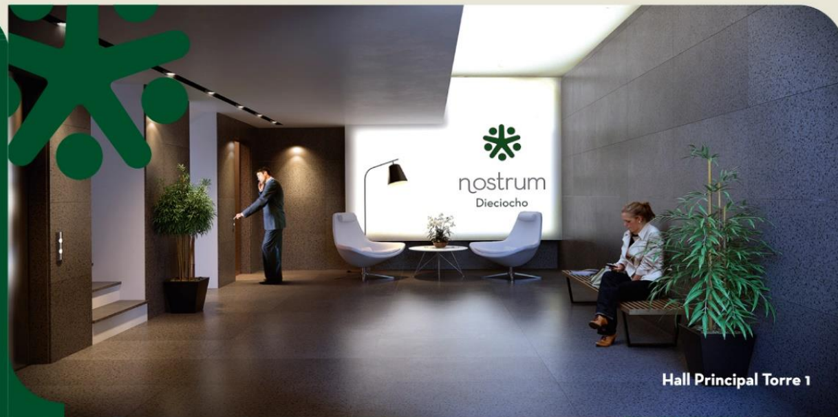
Hall Principal Torre 1

Salones de Usos Múltiples en los coronamientos de las 3 torres con parrillero, cocina, baño y amplias terrazas perimetrales de expansión. Un lugar con vistas despejadas, desde donde se puede contemplar el Río de la Plata tanto hacia el norte como hacia el sur, así como los principales edificios icónicos que caracterizan la trama urbana de Montevideo.