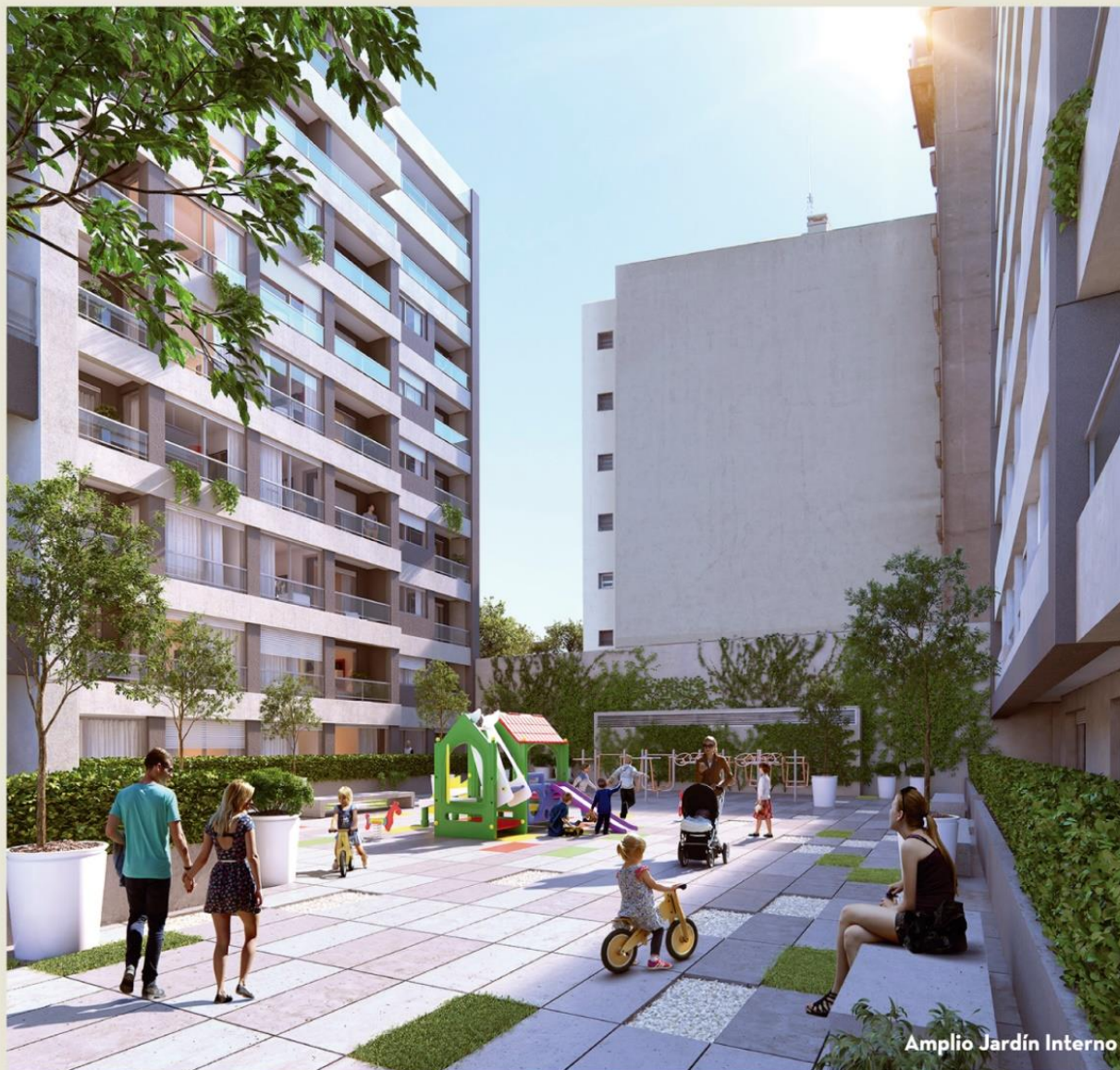
Amplio Jardín Interno