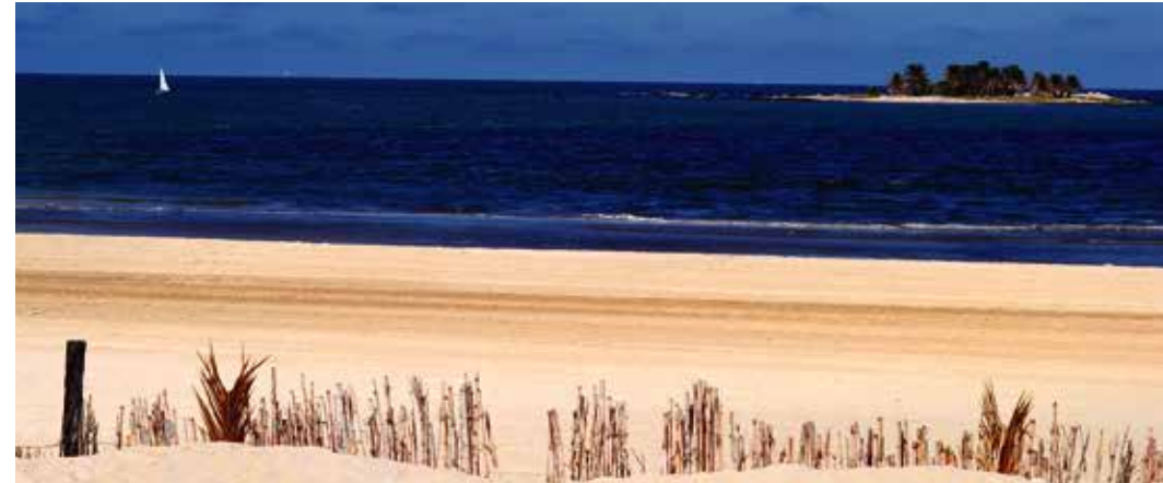
CONTACTO CON LA NATURALEZA

EL EMBLEMÁTICO BARRIO DE MALVÍN, MANTIENE INTACTOS SUS RAZGOS DE ANTIGUA ZONA DE BALNEARIO PLAYA, ESPACIOS VERDES, VECINOS QUE SALUDAN AL PASAR. ESTOS RAZGOS SE SUMAN A UN PRESENTE DE CONEXIÓN INMEJORABLE CON LOS PUNTOS Y SERVICIOS MÁS IMPORTANTES DE LA CIUDAD