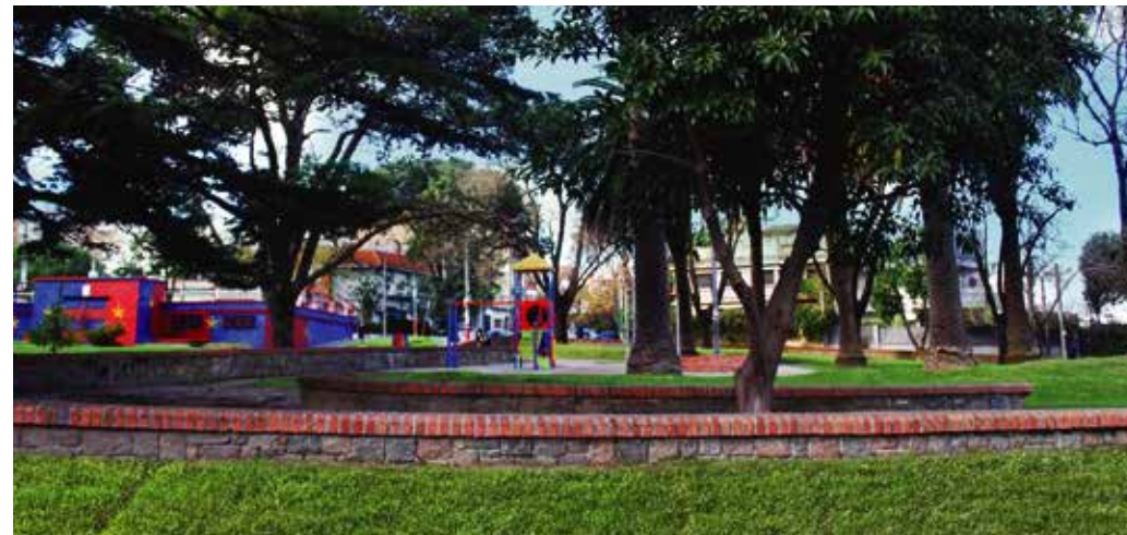
PLAZAS Y ESPACIOS VERDES