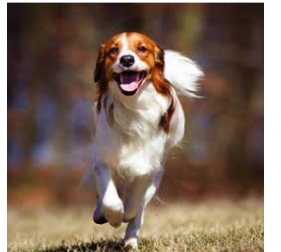
ESPACIOS ABIERTOS, AMIGABLES CON LAS MASCOTAS