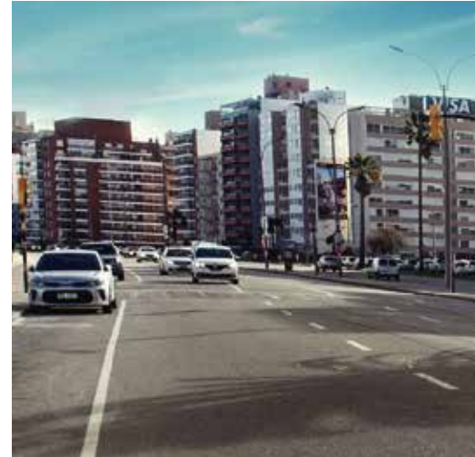
CONECTADO CON LAS AVENIDAS PRINCIPALES