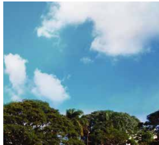
ENTORNO VERDE Y ARBOLADO.

VIDA DE BARRIO, VERDE Y ARBOLADO, CON SEGURIDAD Y CONECTIVIDAD